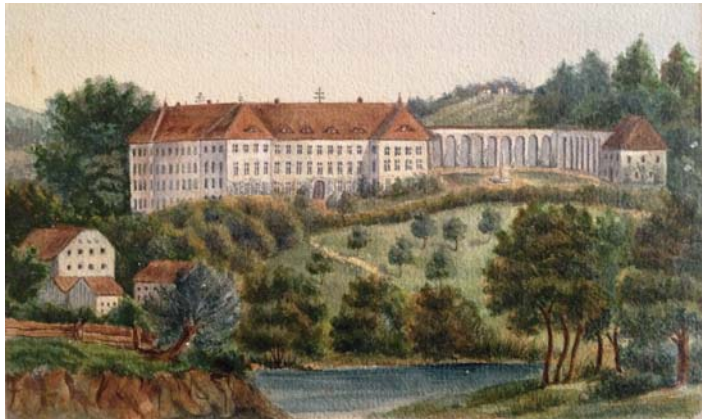
Schloss Zangberg 1862 (Zeichnung um 1870).

Die Ökonomie des Klosters nahm mit zwei Kühen ihren Anfang. Alle Schwestern arbeiteten in Haus, Garten und auf den Wiesen. Doch die nicht enden wollenden Arbeit, die Kälte des Winters und das Mühen um ein geordnetes klösterliches Leben in der engen Kapelle taten der