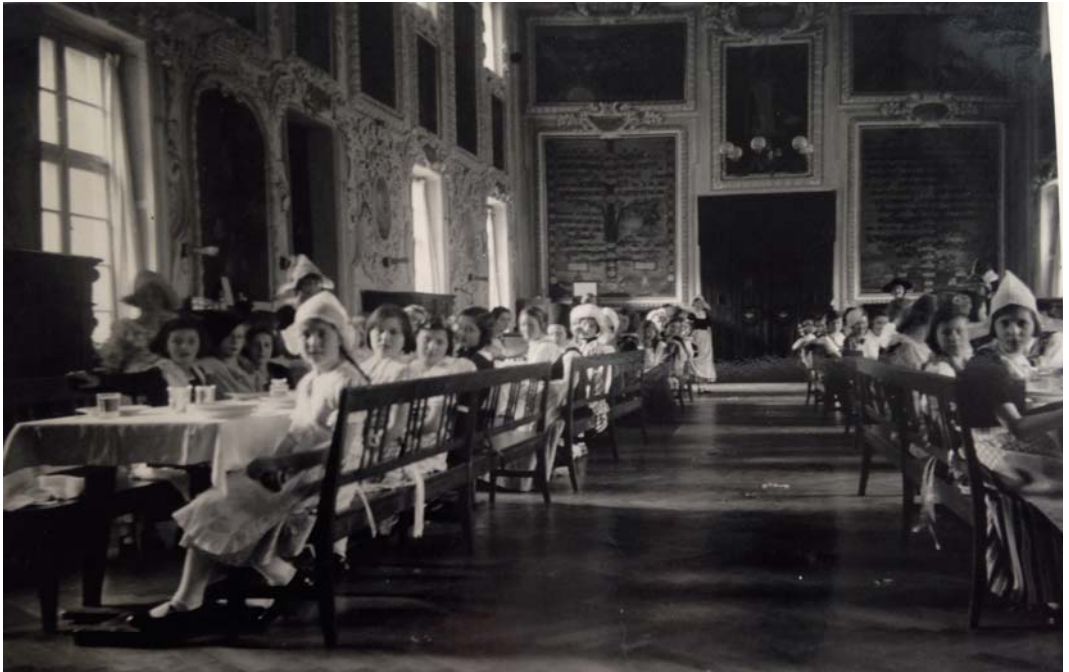
Zöglinge im Speisesaal des Pensionates (Ahnensaal).

Ebenso wichtig waren von Beginn an die Klassentreffen, vormals Klassen- oder Altentage genannt, die nicht nur in Zangberg stattfanden und stattfinden, sondern auch andernorts trafen sich „Alt-Zangbergerinnen“ in kleinen Gruppen zu „Zangberger Kränzchen“.