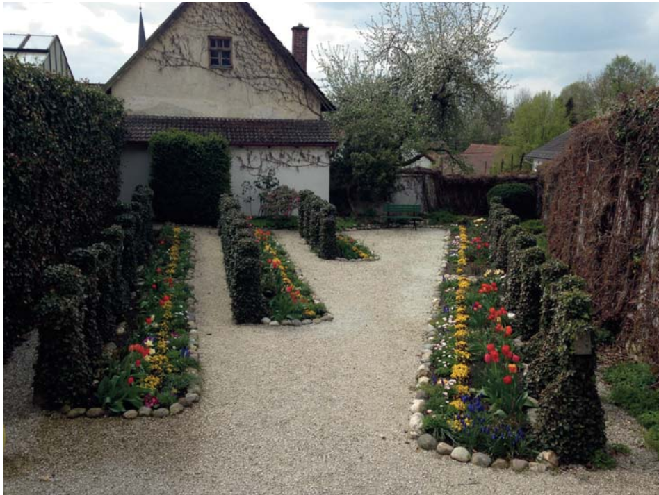
Zangberger Klosterfriedhof 2017.

Ihnen gebührt also der Dank für das, was heute ist und mit ihnen soll nun berichtet werden, wie es dazu kam.