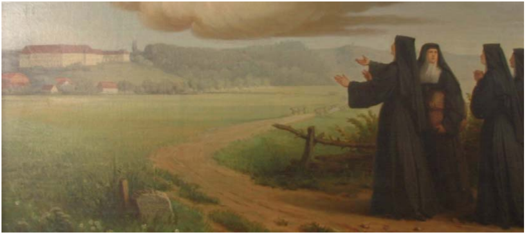
Schwestern ziehen nach Zangberg (Bild des Hl. Erasmus in der Klosterkirche, Detailaufnahme).

sich, um eine Erziehungsanstalt einzurichten. Monatlang schliefen sie auf dem Boden, nutzten Holzböcke als Sitzmöbel, trugen Bänke hin und her. Und schon Ende September 1862 konnten 72 Zöglinge (Schülerinnen) in Zangberg das Pensionatsleben beginnen. Mit Stellwägen wurden sie in München abgeholt und am Ende des Schuljahres zurückgebracht.