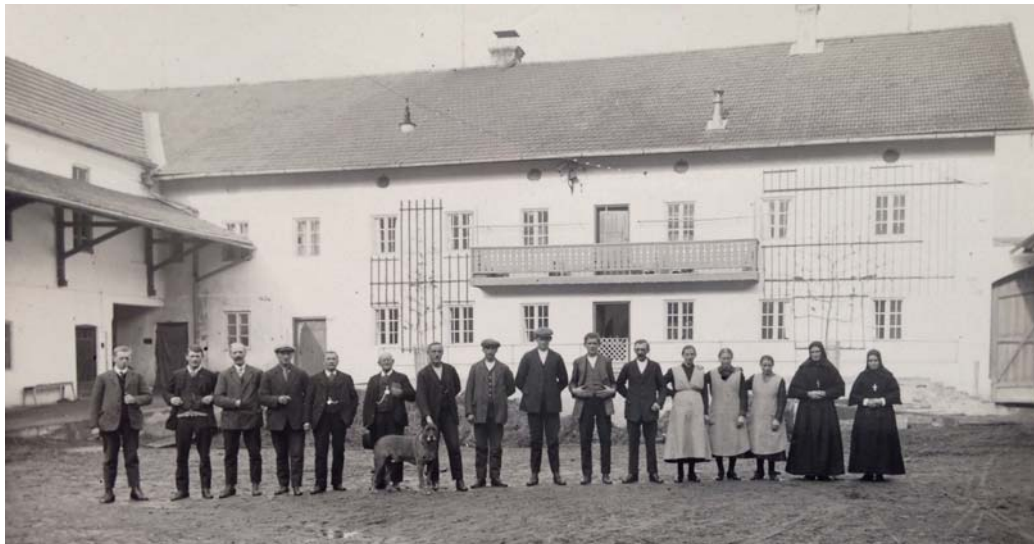
Klosterhof in Palmberg um 1920.

Mit Erlaubnis des Bayerischen Staatsministeriums war der Palmberger Hof ab Juli 1949 berechtigt, ländliche Hauswirtschaftslehrlinge aufzunehmen und auszubilden.