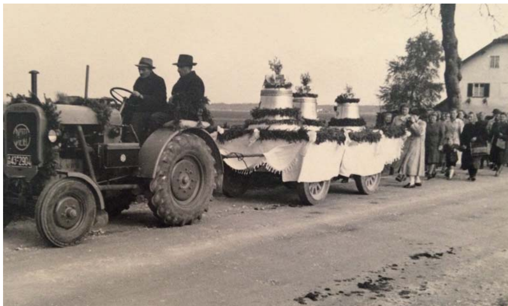
Ankunft der neuen Kirchenglocken in Zangberg am 15. Mai 1951.