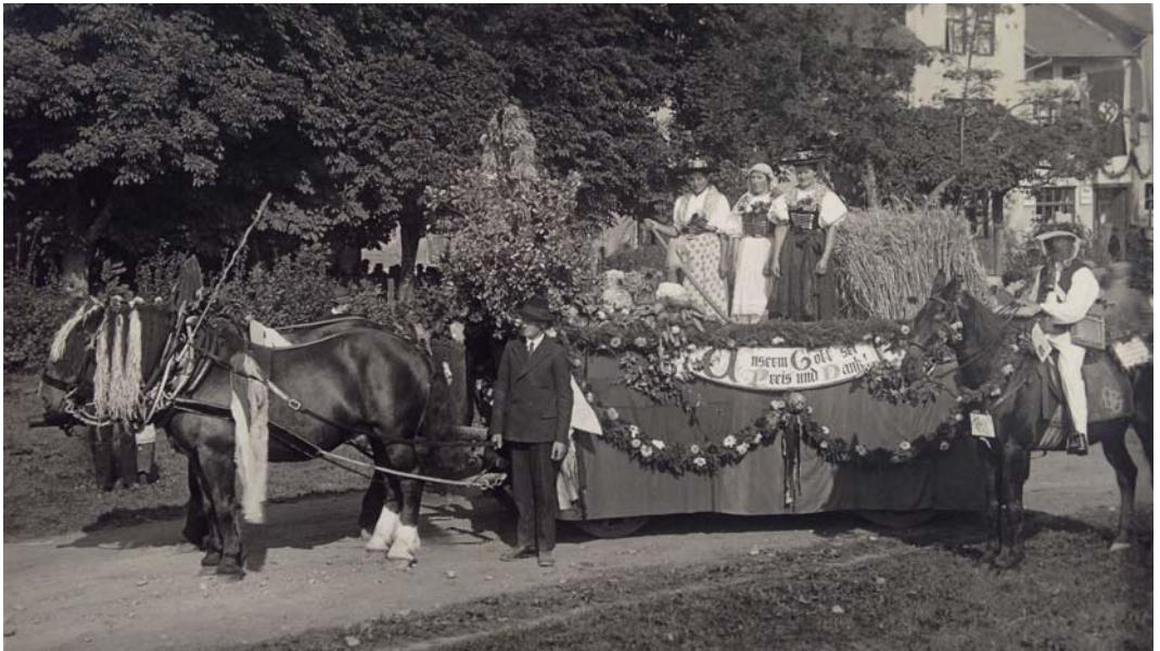
Erntedankwagen des Klosters Zangberg 1934.

statt und dauerte 2 ½ Stunden. Die Kinder der ersten 4 Klassen beteiligten sich mit der Vorführung eines Reigens und alle trugen einen Sprechchor vor. Neben einem Lampionumzug war eine Ansprache des Oberbergkirchner Ortsgruppenleiters zu hören. Das „1. Deutsche Erntedankfest“ Ende September 1934 wurde mit festlichen Wägen begangen, etwa 19 an der Zahl. Das Kloster stellte einen reich geschmückten Wagen, der sich nach Ampfing begab. „Er war reich geschmückt mit Spruchbändern, Taxen und Blumen und Kräutern; eines der 3 Ökonomie-Mädeln kniete als hl. Notburga mit ihrer wunderbaren Sichel in einem Ährenfeld, von ihren Gefährtinnen ehrerbietig umringt, ein Wagen führte das Rosenwunder vor, ein anderer den hl. Isidor mit pflügenden Engeln, ein Wagen stellte die Flachsbereitung dar, ein Wagen ein kleines Bauerngut, Felder und Wiesen, auf einem Wagen wurde sogar gedroschen. Ein Wagen war eine Blumenpyramide oben saß ein weißgekleidetes Mädchen und hielt die Zügel in Händen; mit bunten Schürzen bekleidete Knechte führten die 6 Rappen. Unser Wagen erntete den 5. Preis. Das Fest soll sehr froh und schön gelungen sein. Die Ordnung war von der SA geleitet.