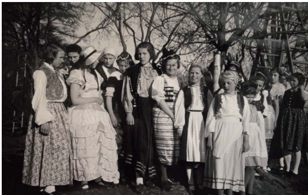
Zöglinge nach einer Theateraufführung.

Die Feste wurden gefeiert wie sie fielen und sicher war ein besonderer Höhepunkt der Dreikönigstag. Der alt-französische Brauch dieses Tages, die Wahl der Bohnenkönigin, wird traditionell in allen Heimsuchungsklöstern weltweit bis heute begangen; in Zangberg wurde er auch mit den Kindern des Pensionates gefeiert. In den Kloster-Annalen heißt es dazu: „Es wurde in Zangberg eingeführt, dass die Zöglinge sich ihre Königin selbst wählen dürfen, nach einer Liste, die von der Obermeisterin gebilligt worden. Diese neugewählte Königin bestimmt dann selbst ihren Hofstaat, der hierauf seine Huldigung darbringt. Am Abend des großen folgenden Rektionstages ist Hofball, wobei alle in ihren verschiedenen Chargen figurieren, und sich bis ungefähr 11 Uhr köstlich unterhalten. Ein Hauptvergnügen ist für sie dabei das Erscheinen der ganzen Gemeinde, der sie in wohlgeordnetem Zuge durch den Zeremonienmeister oder Hofnarren sich vorstellen lassen.