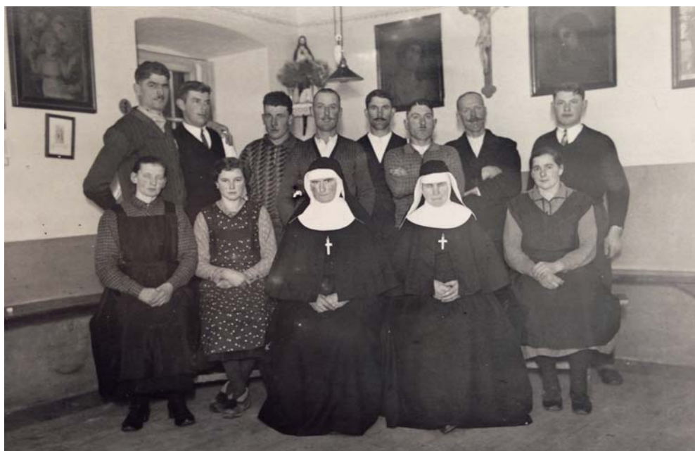
Windenschwestern und Mitarbeiter des Klosterhofes Palmberg 1935.