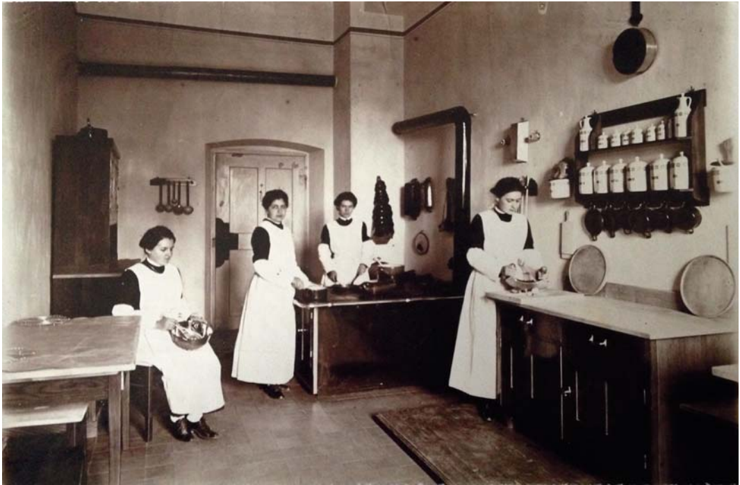
Schulküche um 1925.

Auch für die Freizeit wurde gesorgt. Der große Park lud und lädt zu Spaziergängen und zur Erholung ein. In späteren Jahren (um 1920) kamen ein Spielplatz mit Rundlauf und ein Tennisplatz auf der Kanalwiese hinzu.