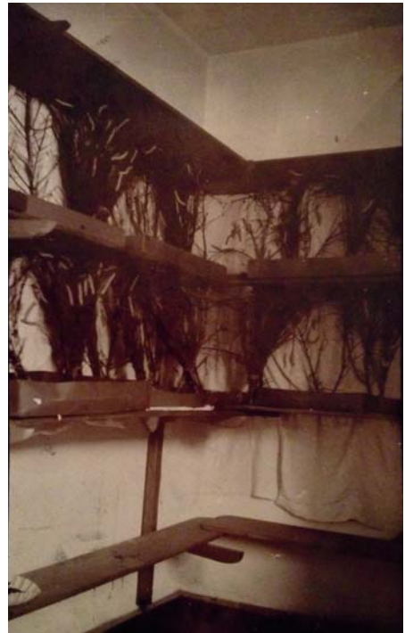
Seidenraupenzucht in der „Dörre“ oberhalb des Backofens von 1894 bis ca. 1950.

Tag für Tag kamen nun Väter und Familienangehörige ins Kloster um sich zu verabschieden. Sie nahmen geweihte Amulette und Medaillen entgegen und gingen nach