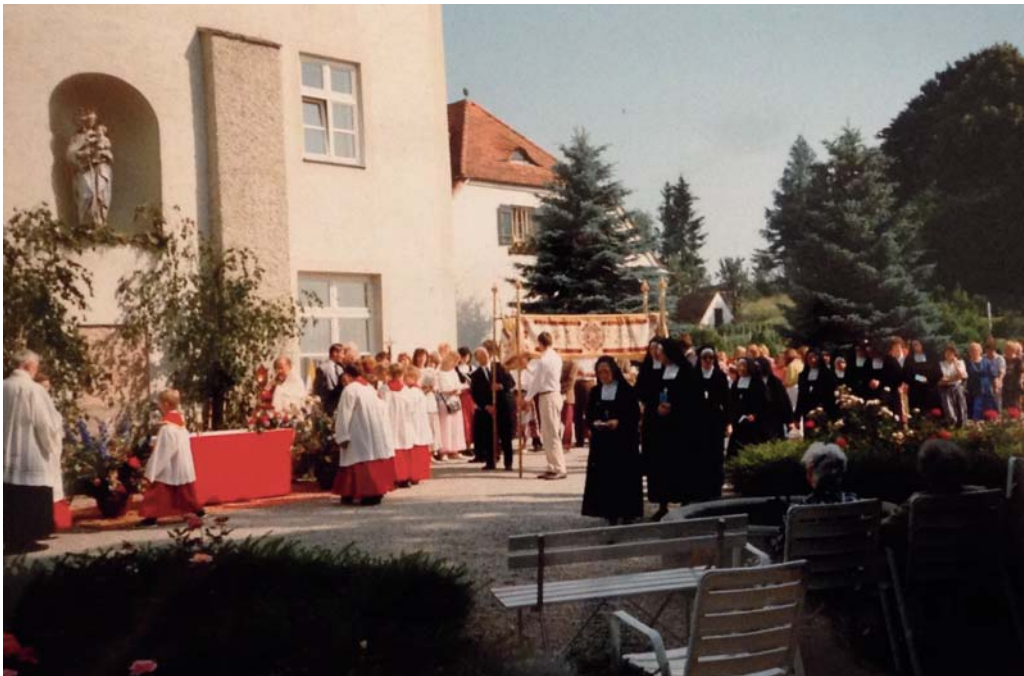
Fronleichnamsprozession im Kloster Zangberg in den 1990er Jahren, hier Altar am Lourdesbau.

Die Geschichte der Zangberger Fronleichnamsprozession soll an dieser Stelle erwähnt werden. Fand sie ursprünglich, mit erzbischöflicher Genehmigung, für Schwestern und Zöglinge ausschließlich auf dem Klostergelände statt und wurde vom Spiritual gehalten, konnte sich ihr später die Dorfbevölkerung anschließen. Der Verlauf und die Plätze der Altäre wechselten im Laufe der über 100 Jahre. Solange die Prozession mit dem Allerheiligsten noch im Klostergelände stattfand, ging, nach der Aufstellung des Zuges an der Kirche, der Weg zum ersten Altar im Bräuhausgarten, dann zog man über den Parkplatz des Klosters durch das Wiesentor zum Altar beim Spielplatz und den Berg hinauf zu Maria Lourdes am Gartenbau. Zurück ging die Prozession durch das Schreinereitor hinaus, an der Kirche entlang, zum letzten Altar am Kirchenvorplatz. Seit 2007 führt die für ein Dorf recht beeindruckende und vom Kirchenchor schön gestaltete Prozession auf wechselndem Weg von der Kirche über den Dorfplatz nach Schloss Geldern und wieder zurück zum Kirchenvorplatz. Die Schwestern, denen es möglich ist, gehen, wenn auch nur eine Teilstrecke, mit der Prozession mit. Vielleicht verdeutlicht sich für die Bevölkerung das älter und kleiner werden der Schwesterngemeinschaft am ehesten bei der Fronleichnamsprozession, wenn jedes Jahr weniger Schwestern den Weg durch das Dorf mitgehen.