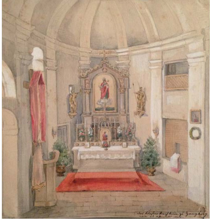
Alte Schlosskapelle: Zeichnung aus den Annalen des Klosters Zang-berg um 1870.