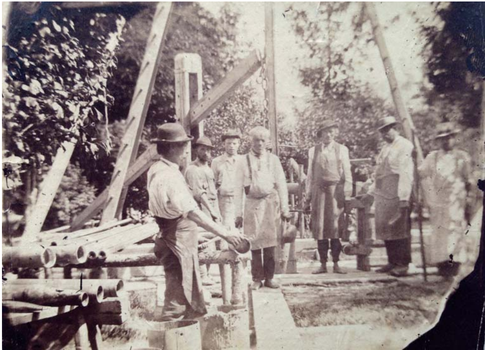
Erweiterung der Wasserleitungen auf dem Klostergelände – Arbeiten um 1920.