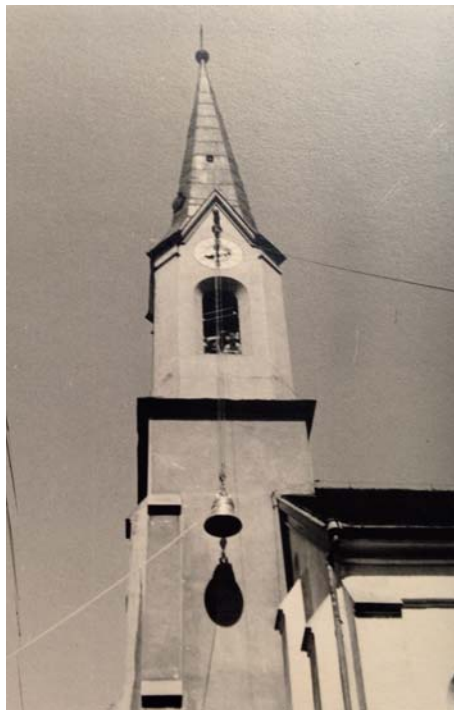
Die neuen Zangberger Kirchenglocken zwischen Himmel und Erde: Glockenaufzug 1951.