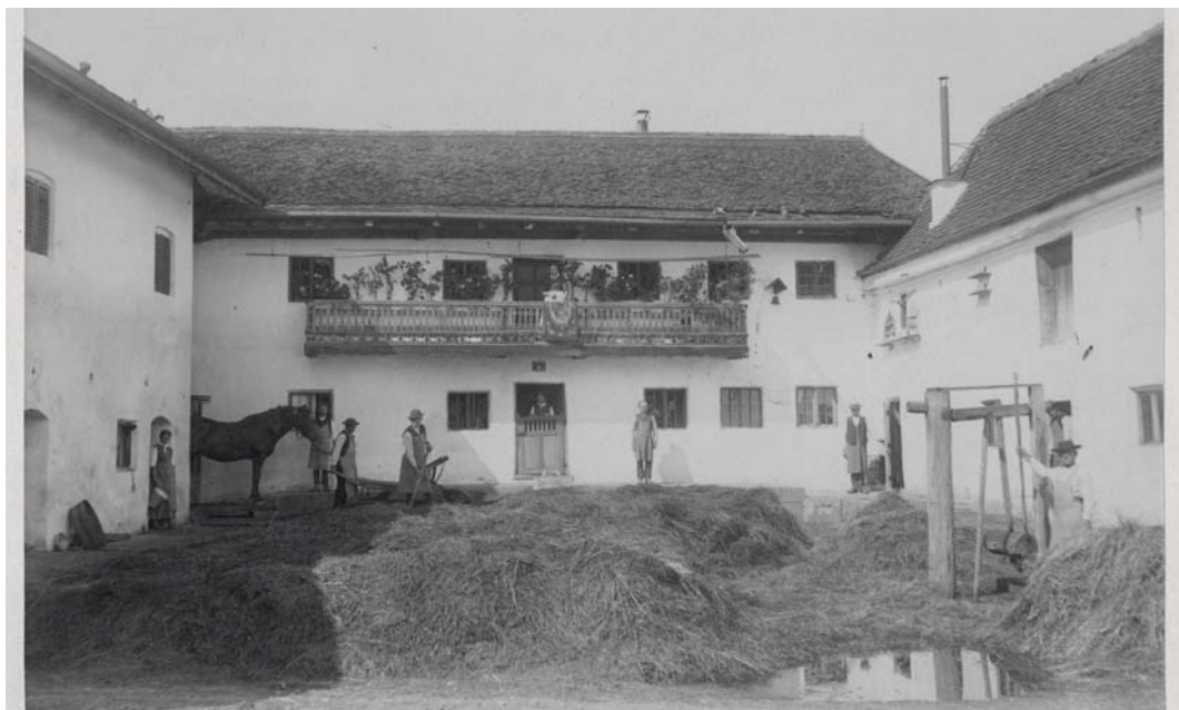
Klosterhof in Ampfing.

In Ampfing wurde stattdessen der Dörfelhof erworben. Nachdem die Windenschwestern 1882 von dort abgezogen wurden, lag die Verantwortung der Bewirtschaftung beim Baumeister mit einer Bauköchin, Knechten und Mägden. Die Ökonomie im Kloster und der Hof ergänzten sich hervorragend. Die Bewohner von Kloster und Hof konnten dadurch ausreichend mit den Früchten des Feldes und Gartens, Fleisch, Eiern, Milch und Honig verköstigt werden.