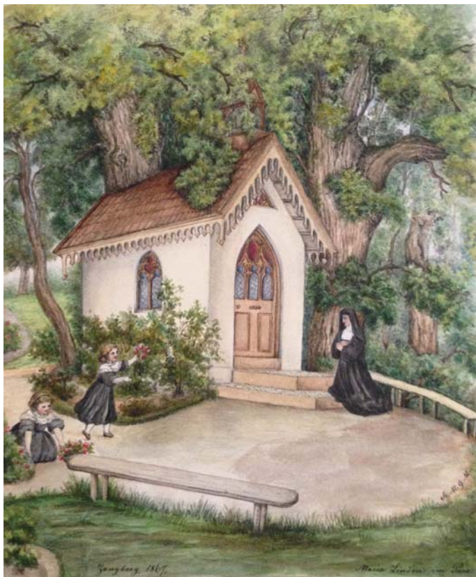
Kapelle „Maria Linden“ im Klosterpark (Zeichnung Kloster Zangberg 1867).

Der Ort „Maria Linden“ war ein sehnlicher Wunsch der ersten Oberin des Klosters Mutter M. Gonzaga. In eine Linde wurde 1865 eine Nische gefertigt, in die eine Muttergottes Statue ihren Platz fand. Zöglinge und Schwestern schmückten sie und nach zwei Jahren konnte ein hölzernes Kapellchen gebaut werden. Seitdem war sie Ziel vieler Prozessionen und fester Bestandteil der Fronleichnamsprozession; sie wurde 1870 von zwei Schwestern ausgemalt. Im Jahr 1915 war die Linde so morsch, dass sie die Kapelle gefährdete. Baumeister Albrecht aus München ließ die Linde mit Zement ausmauern und erneuerte die Kapelle. Dennoch musste die Linde später gefällt werden. Besonders die Schülerinnen verewigten sich mit Dank und Anliegen an den Innenwänden des „Wallfahrtsortes“. Heute ist er noch das Ziel manches Gastes, der seine Anliegen zur „Lindenmuttergottes“ trägt.