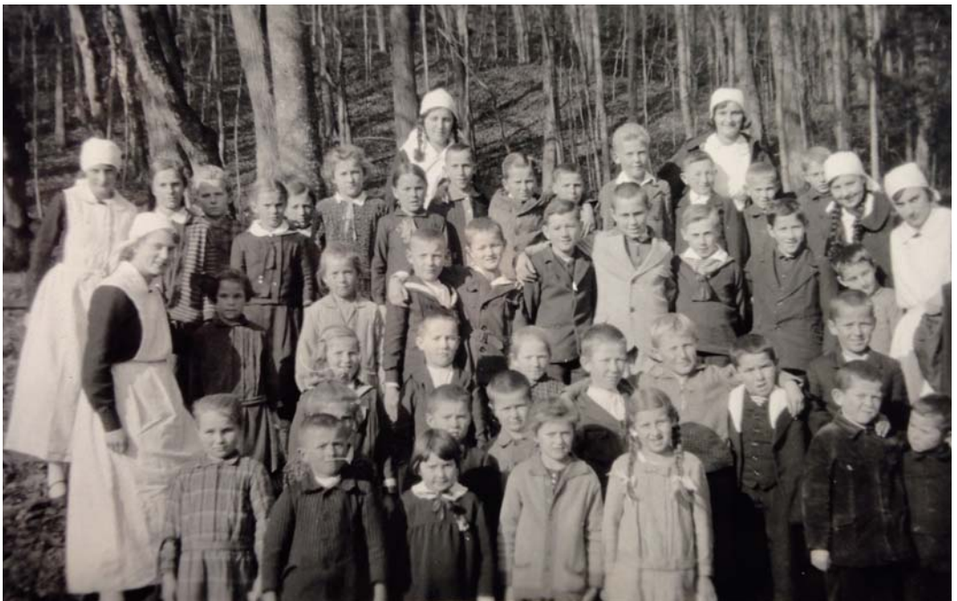
Elisabethtag 1931: Abiturientinnen des Pensionates und Zangberger Dorfkinder.

Pensionat, so auch im März 1931, wo sich die 11 Abiturientinnen nach bestandener Prüfung einen sogenannten „Elisabeth-Tag“ wünschten, um armen und bedürftigen Kindern, gleich der hl. Elisabeth von Thüringen, etwas Gutes zu tun. Über die zweite Einladung an die Dorfkinder ist zu lesen: „Am 17. März wurden 20 Zangberger, 14 Buben und 6 Mädeln, in ähnlicher Weise bewirtet. Die Schulkinder waren schon unbefangener, wußten sie ja, was sie erwartete. Unsere Kinder hatten an diesem Tag das Mahl in ihrer Küche zubereitet: Pfannkuchensuppe, Kartoffelpüree zu den Würsteln und Blätterteig-Runderln. Mützen, Strümpfe, Handschuhe, Schuhe, Bücher p.p. wurden verlost. Unsere Kinder zogen um ½ 11 Uhr noch strickend hinaus zur Pforte um bis 11 Uhr fertig zu sein. Mehrere unserer Zöglinge hatten sich ihr Frühstücksbrot und Obst vom Munde abgespart, um es ihren kleinen Gästen heimlich zuzustecken. Die Schulkinder interessierten sich sehr für den Grammophon; nach dem Essen ließ man sie auf die Bänke stehen, ihn genauer spielen zu sehen. Als alles zu Tisch saß, bemerkte man, daß ein Büblein (Ministrant) fehlte – er war zu schüchtern. Sogleich liefen 3 Zöglinge hinunter zum Dorfplatz, suchten unter der spielenden Schar den Vermissten und führten ihn triumphierend herbei. Vor 12 Uhr wurden die kleinen Gäste in die Kirche geführt ein Vater unser für Bonne Mére zu beten. Beide Parteien kamen am Tag nach der Bewirtung zum Dank in die hl. Messe.“ 73