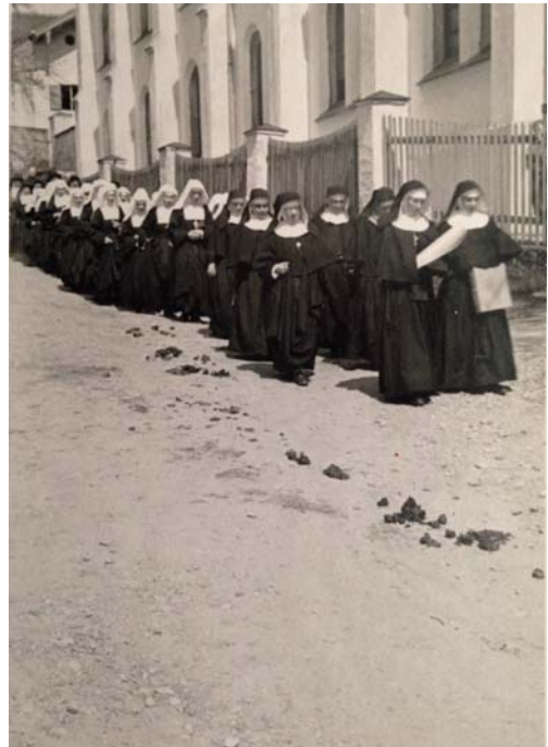
Auszug der Schwestern aus dem Kloster am 5. Mai 1941.

Der Chor wurde mit einer Mauer abgetrennt, so dass die Schwestern nur durch die Kirche oder die Ökonomie hineinkonnten. Wann immer es möglich war, kamen sie zum Gottesdienst im Chor zusammen. „Seit dem 30. Juni singen wir das Offizium nicht mehr. Die Vorsicht mahnt uns, uns so wenig als möglich hören zu lassen. Daß wir von unseren Bedrängern beobachtet und belauscht werden, ist für uns nichts Neues mehr.“ 101 Mit dem späteren Einbau von Doppelfenstern war der Gesang wieder möglich.