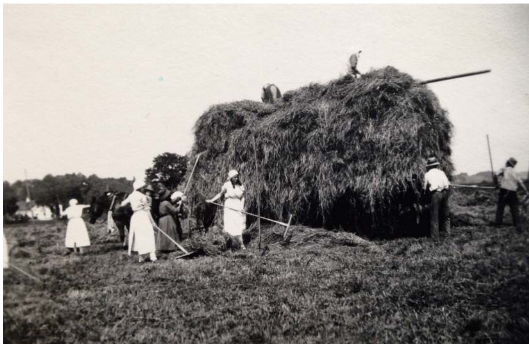
Zangberger Zöglinge während des Reichsarbeitsdienstes.

Unterstützung der Dorfbewohner, welche die Lebensmittel zum Priesterhaus brachten. Eine weitere behördliche Neuerung stieß weitläufig auf größte Entrüstung und brachte endlose Konfusionen im Bahnverkehr mit sich: die Einführung der Sommerzeit!