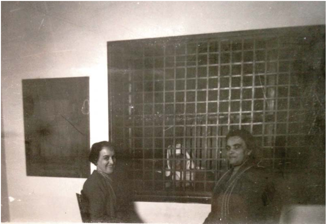
Ehemaliges Sprechzimmer an der Klosterpforte um 1930.

Innere Pforte mit Esszimmer bot vielen Gästen Raum: Alteingesessene, Freunde des Hauses, Angehörige der Schwestern, ehemalige Schülerinnen mit Familie, Hilfesuchende.