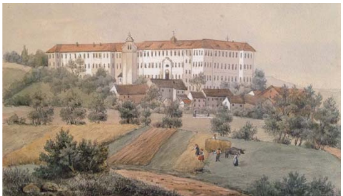
Schloss Zangberg 1862 (Zeichnung um 1870).