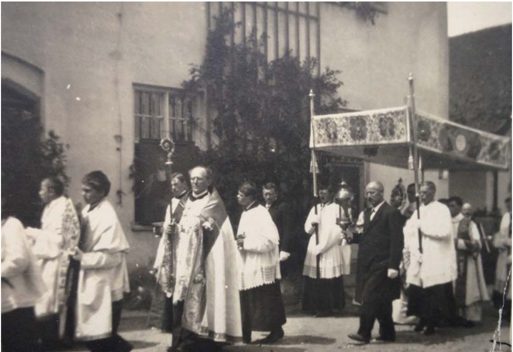
Zangberger Fronleichnamsprozession mit Nuntius Eugenio Pacelli 1918.

April 1917 von Altötting kommend, machte er Halt in Zangberg. Nach einem Besuch in der Kirche, wo er allen Anwesenden den Segen erteilte, kam der hohe Herr ins Kloster. Sehr interessiert an allem, wurde er durchs Haus geführt und da das Wetter sehr sommerlich war, durchquerten Nuntius und Gefolge ebenso den ganzen Park. Am Abend fuhr er unter Glockengeläute und Herbeilaufen der Bevölkerung wieder ab. Während der Jahre 1917 bis 1925 erhielt Zangberg mehrfachen Besuch des Nuntius. Erholungsbedürftig nach Erkrankungen (1918) oder ermüdet wegen seiner zahlreichen Aufgaben war er teilweise für mehrere Wochen zugegen. Bei großer Kälte während seines „Zwangsaufenthaltes“ in den Revolutionstagen 1919 wurde ihm eine eigene Hauskapelle im Sprechzimmer eingerichtet. Dort durften täglich vier Kinder an der hl. Messe teilnehmen.