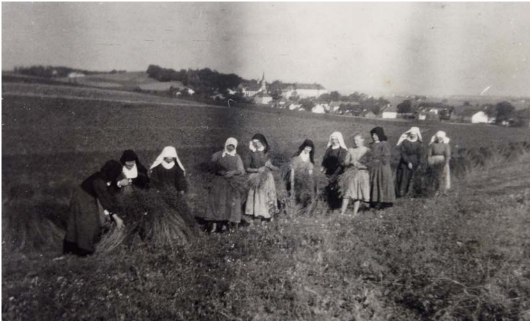
Schwwestern bei der Feldarbeit während des Zweiten Weltkrieges.

Im Laufe des Sommers wurden auch Schwestern zur Hilfe im Heu, auf dem Kartoffel- und Flachsfield eingesetzt. Die weniger gut konstituierten Schwestern gingen in den Wald zum Beerenpflücken. Ab Oktober musste gemäß einer Verordnung Milch an jene Dorfleute ausgeschrieben werden, die keine eigenen Kühe hatten.