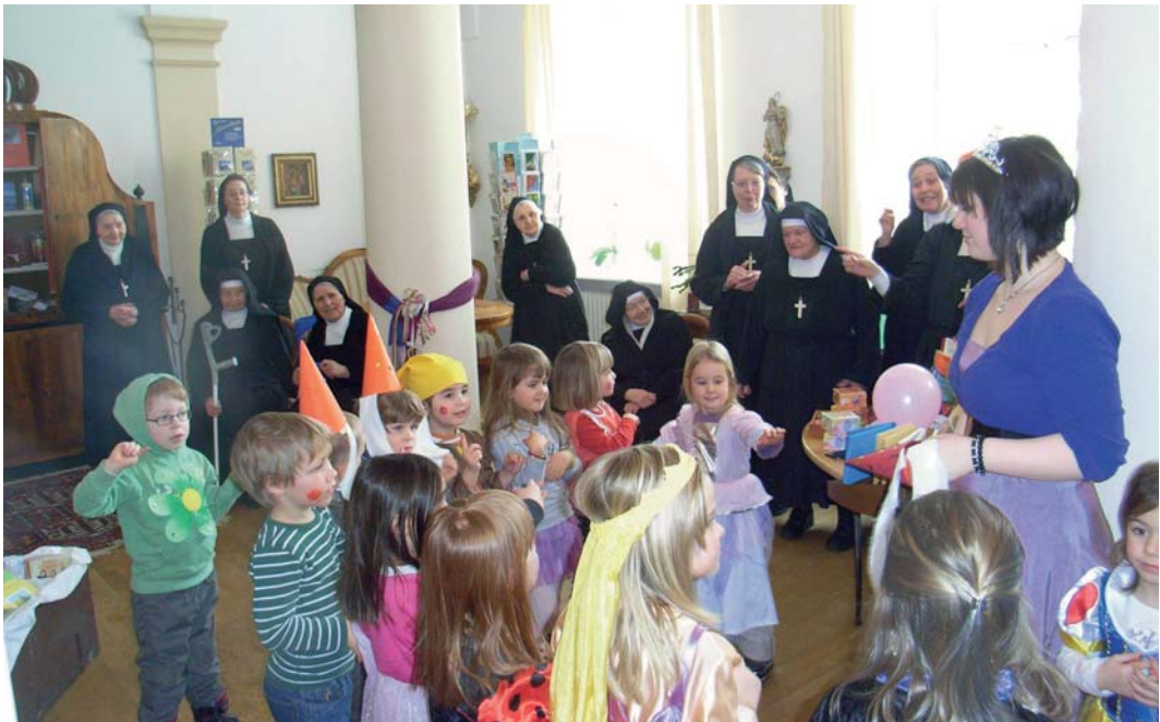
Zangberger Kindergartenkinder in Faschingskostümen in der Klosterpforte (2012).

merkt werden. Der Großteil der Gäste kam an den Wochenenden, so dass es da besonders turbulent und arbeitsreich zu ging; die Werkstage waren hingegen weniger gefragt.